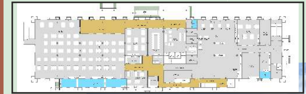
રસોડું, ઠાકોરજીનું રસોડું અને ભોજન શાળા