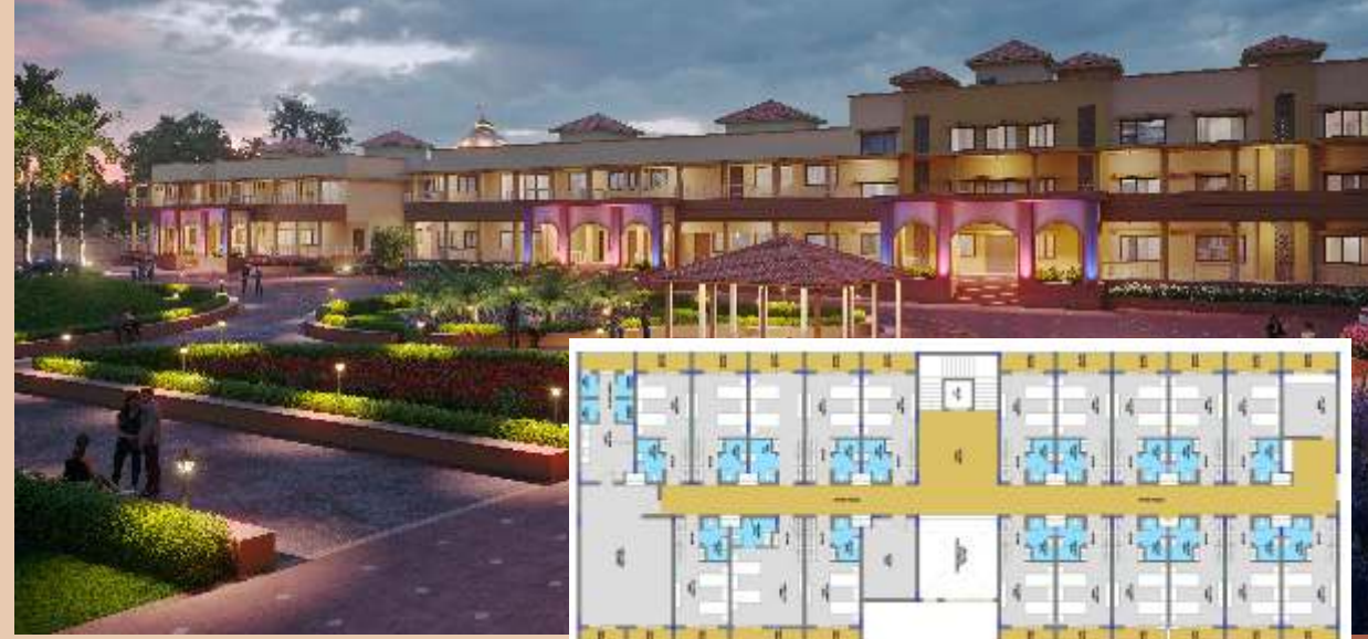
ધર્મકુળ નિવાસ, ઓફિસ અને સંત નિવાસ